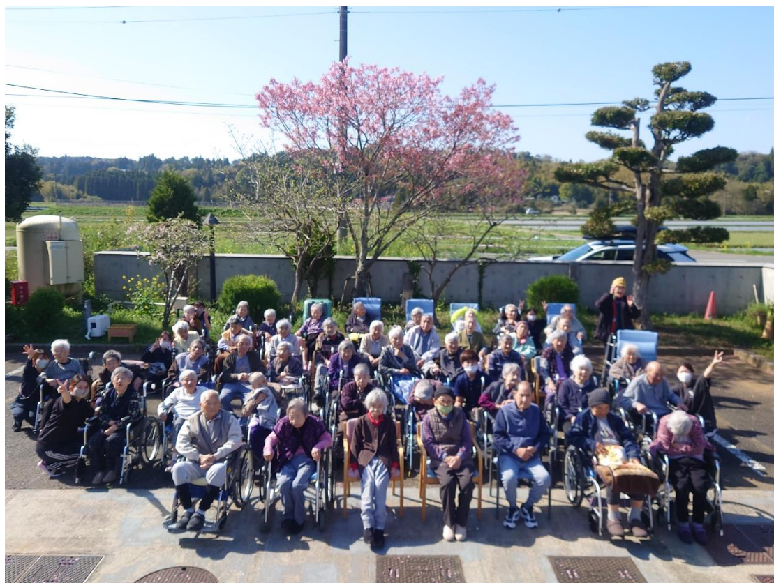
桜の前で集合写真

社会福祉法人 加茂つくし会 特別養護老人ホーム 高滝神明の里 デイサービスセンター 高滝神明の里