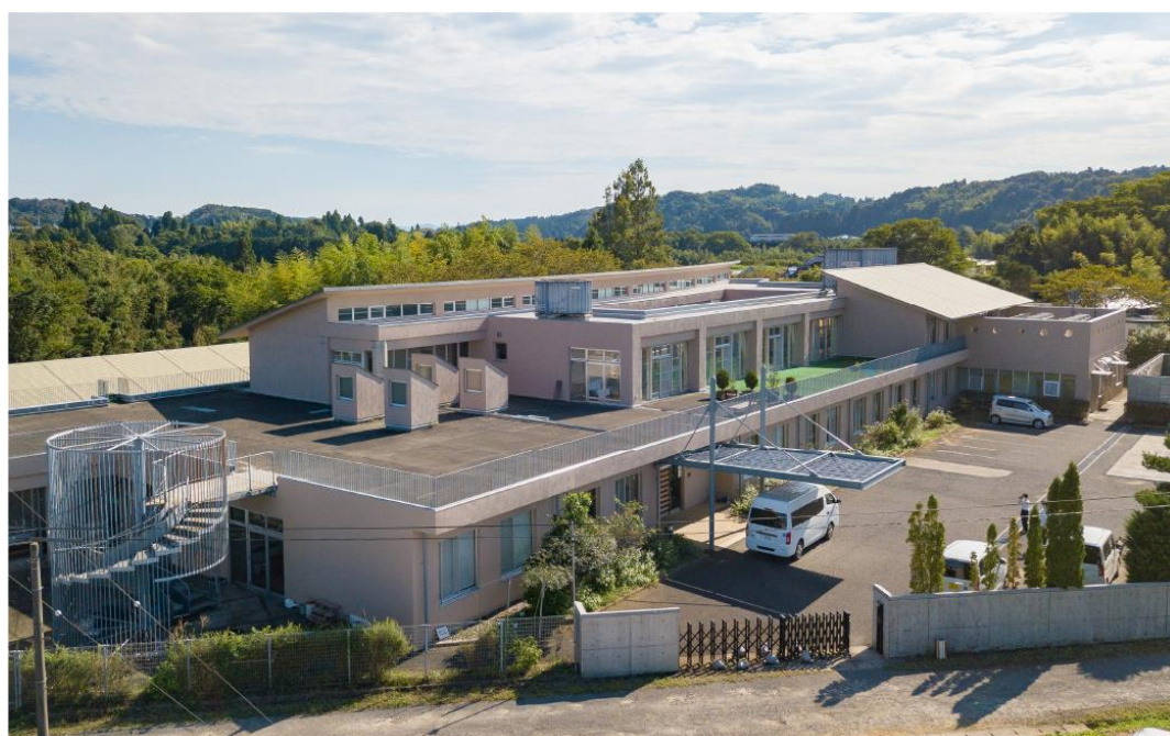
高滝神明の里全景

社会福祉法人 加茂つくし会 特別養護老人ホーム 高滝神明の里 デイサービスセンター高滝神明の里